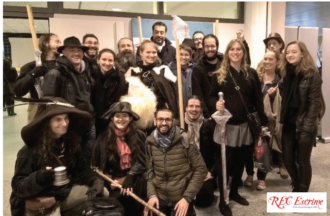
Fous d'Histoire 2016

Le dimanche 23 octobre le REC était de sortie pour sa journée d'intégration ! De nombreux adhérents se sont retrouvés au marché des Fous d'Histoire à Dinan afin de passer ensemble un moment convivial et joyeux pour fêter le début de l'année. Et nous